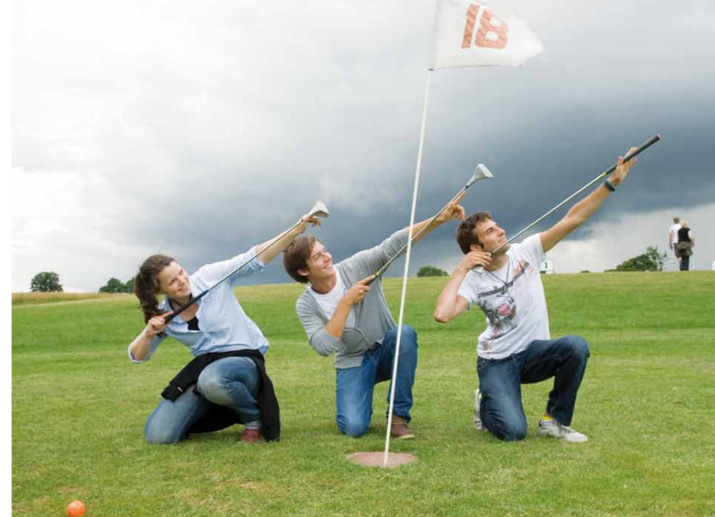
■ Gut Sophienhof 24269 Waabs, T 043 58.10 25